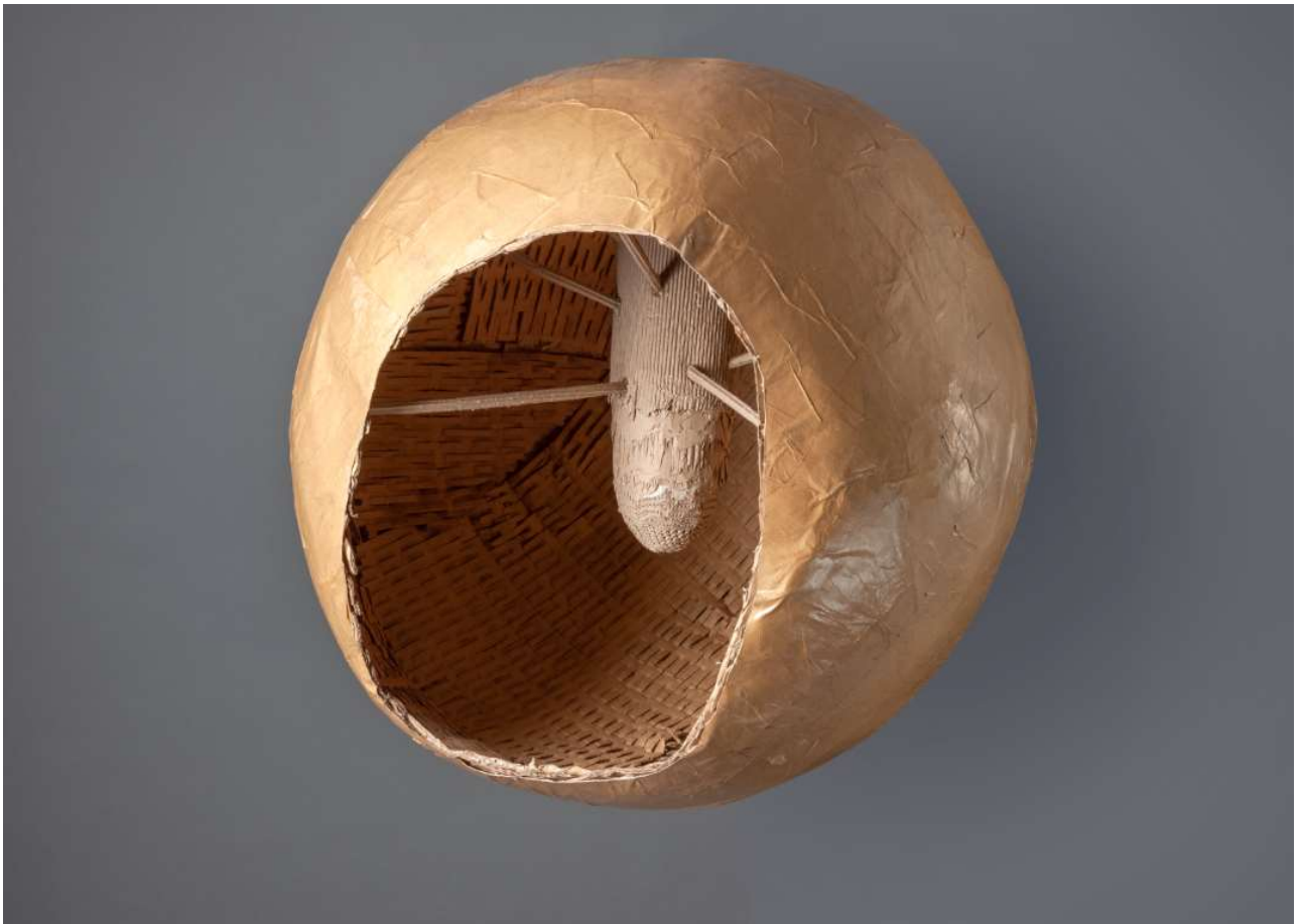
Theo Piršč, 1.S